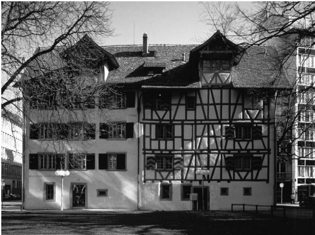
Der Ort des MoneyForums: die Bärenghass-Häuser an der Bärenghasse 20 in Zürich.