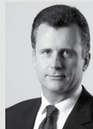
Philipp Hildebrand , geb. 1963, Dr. phil., doktorte 1994 an der Universität Oxford (Internationale Beziehungen). Er war wissenschaftlich und in Privatbanken tätig, bevor er 2003 vom Bundesrat ins Direktorium der Schweizerischen Nationalbank gewählt wurde. Seit 2010 ist er Präsident dieses Gremiums. Er hat sich bei der Bekämpfung von Systemkrisen als strategischer Kopf aufseiten der Behörden einen Namen gemacht.

Zu bedenken sei auch, dass eine nationale Rechtsordnung nicht ausreiche, um Stabilitätsprobleme zu lösen. Nur eine internationale Zusammenarbeit (über Verträge) könne die Risiken im System beseitigen helfen, denn die Problematik der grossen, international tätigen Banken, die zu gross seien, um Pleite zu gehen («too big to fail») oder zu sehr international verflochten («too interconnected to fail»), könne man mit nationalen Regelungen nicht in den Griff bekommen. Die Aufgabe sei gigantisch und scheine aus heutiger Sicht fast unlösbar. Deshalb werde von Politikern volles Commitment und der Wille gefordert, internationale Regelungen zu akzeptieren. Wegen ihrer zentralen Rolle im Finanzsystem gelte diese Aufforderung insbesondere auch für die USA. Manchmal brauche es Ziele, die unerreichbar erschienen: Hätte Kennedy 1963 nicht gesagt: «Wir fliegen zum Mond», wäre es nie soweit gekommen. Wie diese internationalen Regeln genau aussehen werden, ist noch offen, sie werden im Vorfeld der anstehenden G-20-Konsultationen ausgearbeitet. Allerdings ohne Beisein der Schweiz, obschon die Schweiz und insbesondere auch der Redner selber intensiv an der Vorbereitung beteiligt sind und wichtige Inputs gegeben haben und weiter geben werden. Die Reformen dürften nicht auf die lange Bank geschoben werden, wurde gewarnt. Das Window of Opportunity schliesse sich – die Aufmerksamkeit der Staatschefs für das Thema werde noch bis